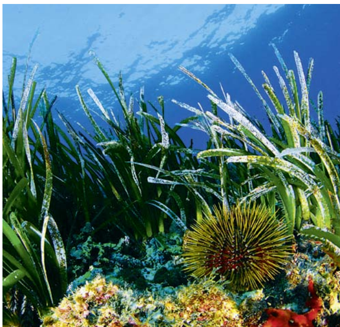
Oursin dans un herbier de posidonies